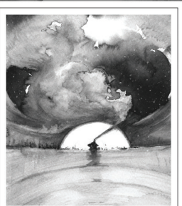
PÓSA LAJOS APRÓ TÖRTÉNETEK